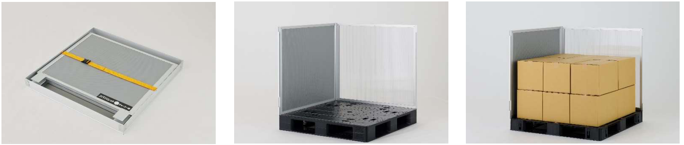
JIT パレットチャーター便 専用パネル（ダンカーゴシリーズ）

本サービスで使用する専用パネルは、当社とボックスチャーターが共同開発したもので、加盟店が使用するさまざまな車種のトラックで効率よく積載することができるように、これまでの「ダンカーゴ」シリーズをさらにスリム化しました。