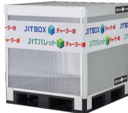
JIT パレットチャーター便 専用パネル(ダンカーゴシリーズ)