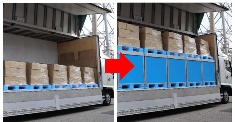
ダンカーゴの使用イメージ