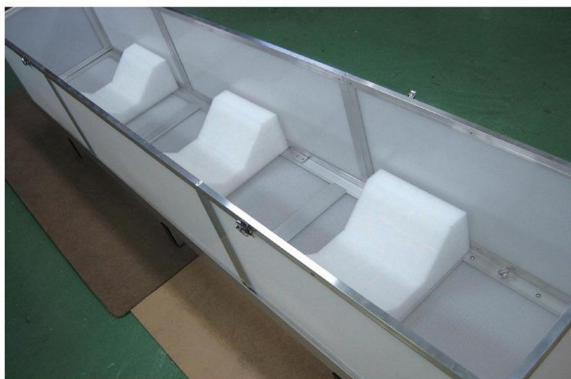
長尺コイル品の胴体を受ける緩衝材付き。