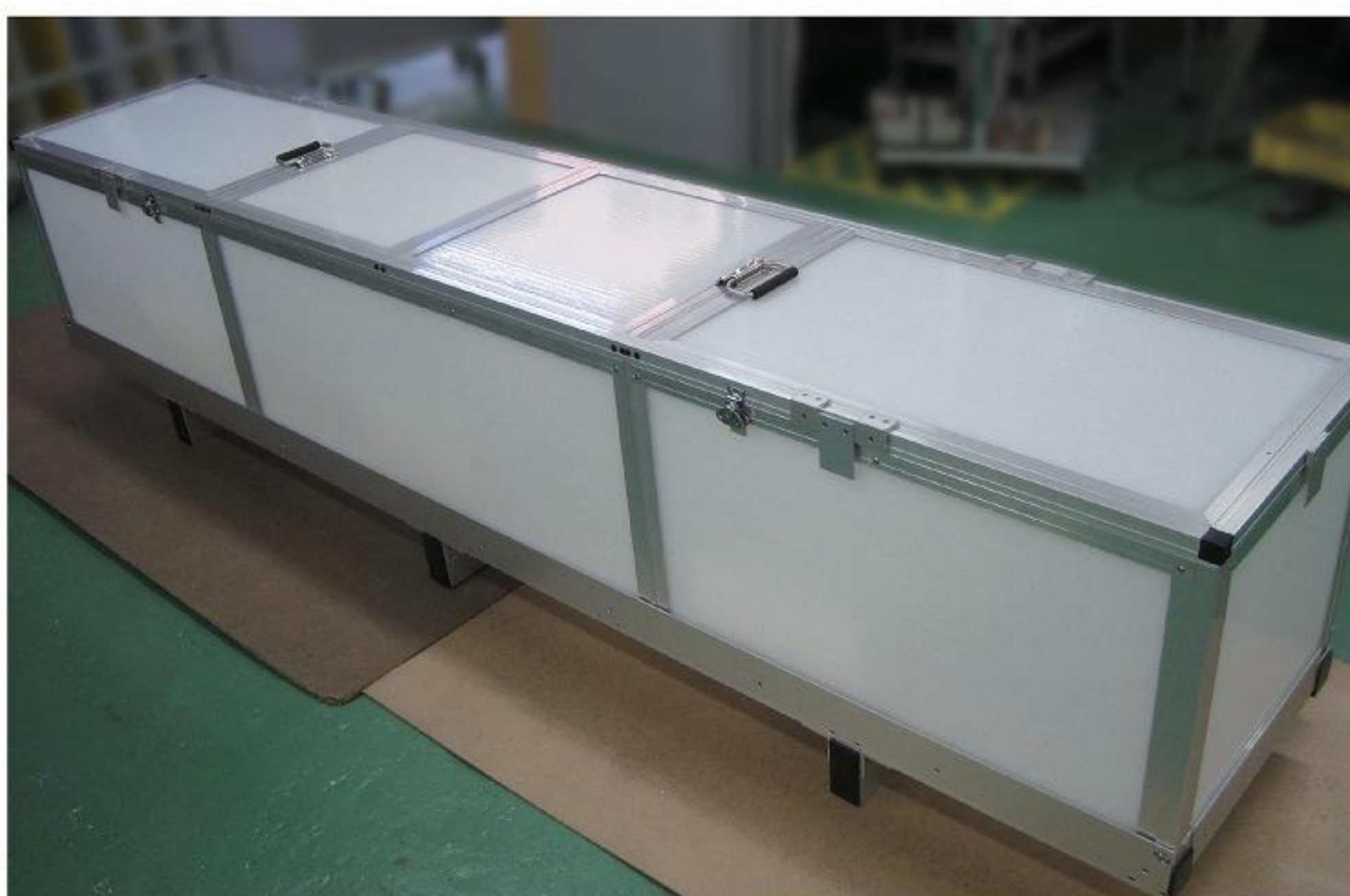
《パネル: TECCELL 岐阜プラスチック工業(株)製》