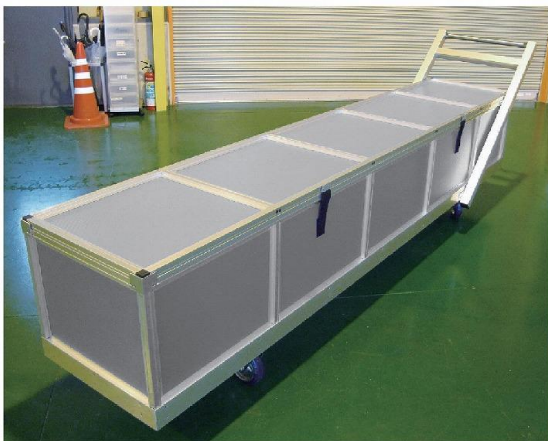
キャスター式 + ハンドル付き