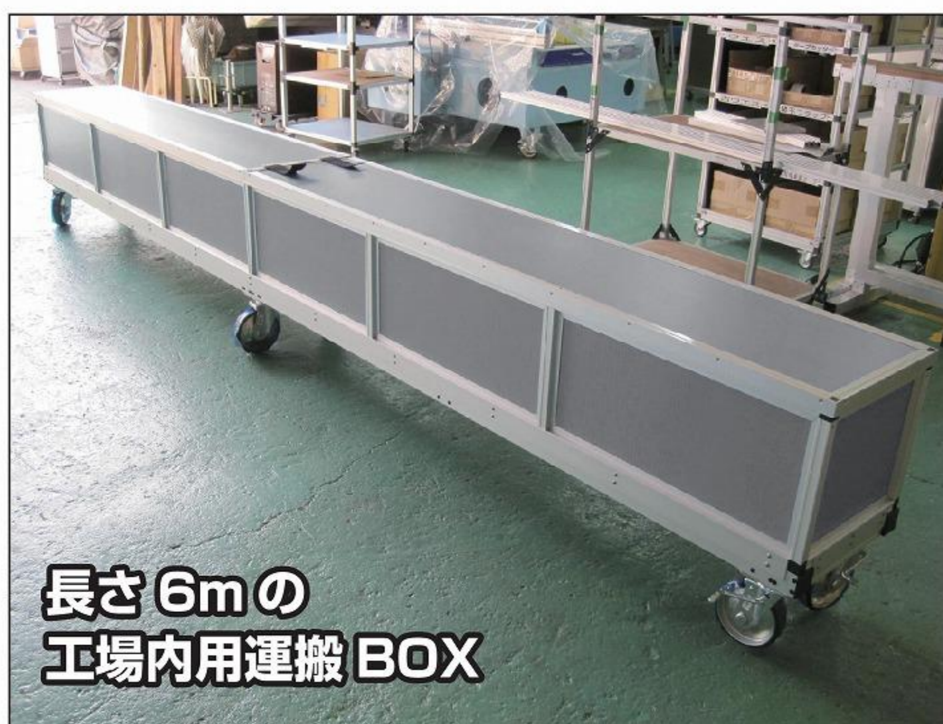
長さ6mの 工場内用運搬BOX