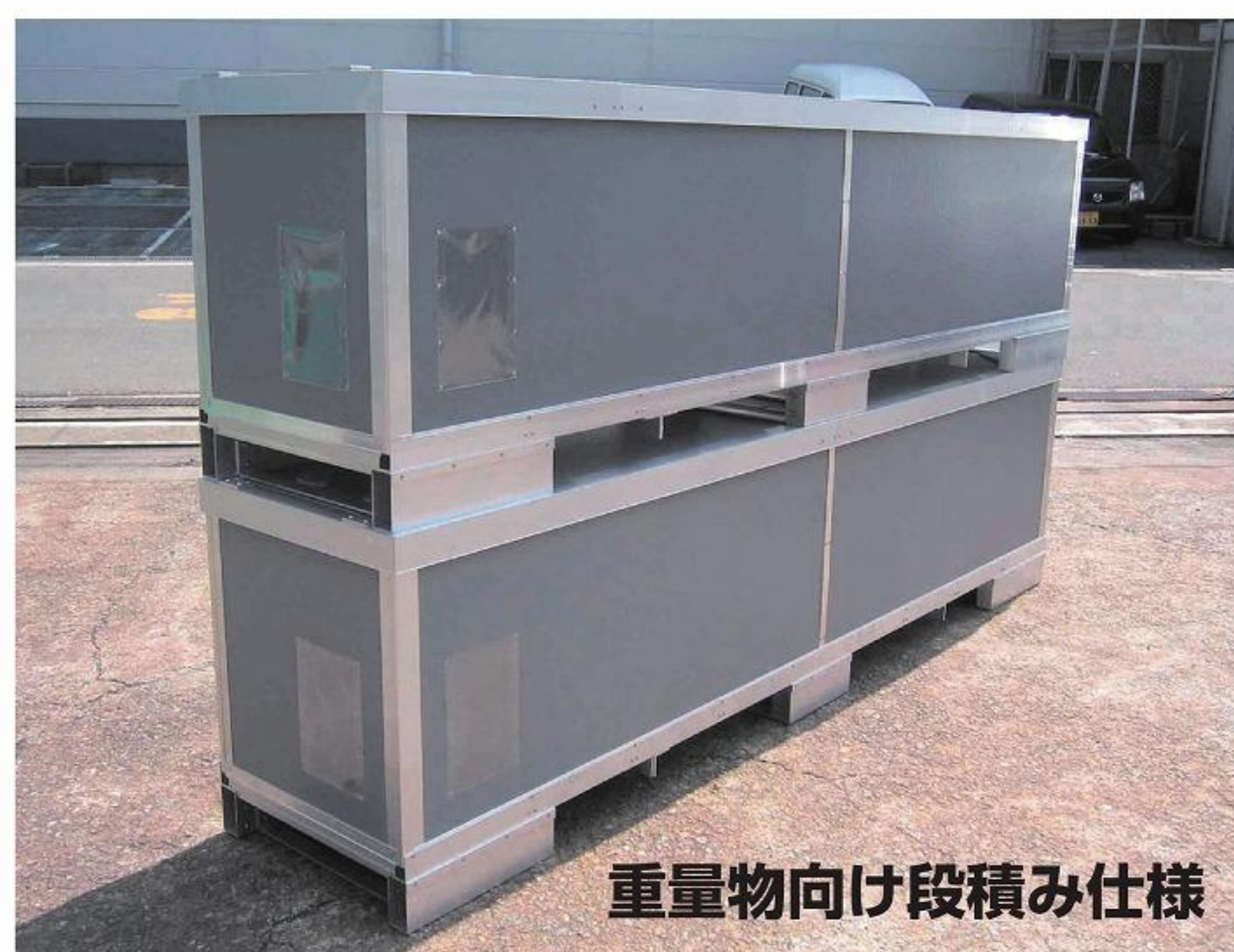
重量物向け段積み仕様