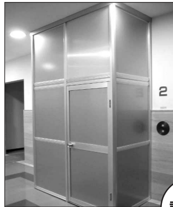
エレベーター工事囲い