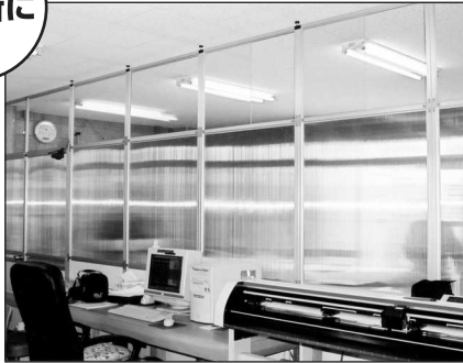
簡易パーティション