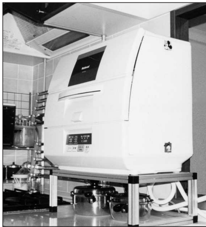
食器洗い乾燥機台