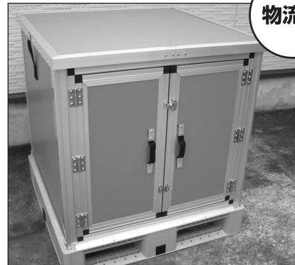
物流ボックス(観音開き仕様)